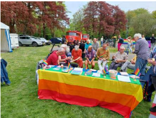
Stand Regenboog Oldambt bevrijdingsfestival 2022

Voor het bemensen van de stand zijn nog vrijwilligers nodig. Dus mocht je vanaf 12:00 tot ongeveer 17:00 zin en tijd hebben laat het ons even weten via regenboogoldambt@gmail.com of 0641258447.