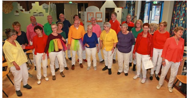
Foto: Regenboog koor Roca Rosa uit Amersfoort